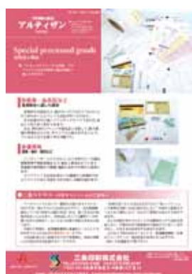
■第11号 11月号 特集：特殊加工製品