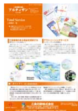
■第12号 12月号 特集：三条製品一覧

三条印刷では様々な製品を開発製造しております、ここでご紹介させていただいている製品はほんの一例です 詳しい資料やご質問は当社営業部までお問い合わせください。 お客様のご要望に応える製品をご提案いたします。