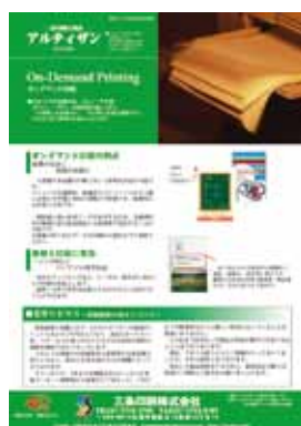
■第6号 6月号 特集：オンデマンド印刷