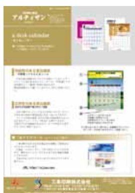
■第9号 9月号 特集：卓上カレンダー