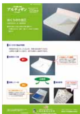
■第5号 5月号 特集：はくりのり加工