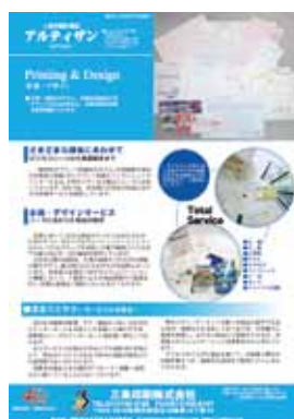
■第7号 7月号 特集：一般印刷・デザイン