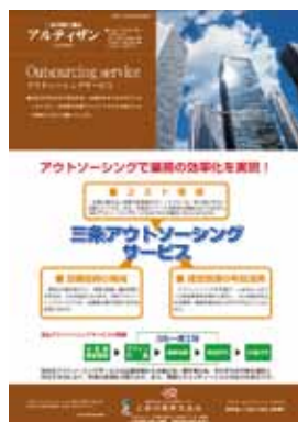
■第2号 2月号 特集：アウトソーシングサービス