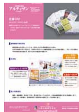
■第4号 4月号 特集：圧着DM