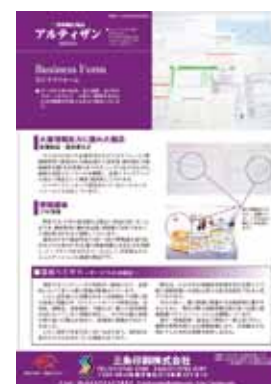
■第8号 8月号 特集：ビジネスフォーム