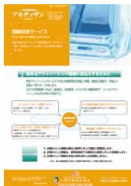
■第3号 3月号 特集：情報処理サービス