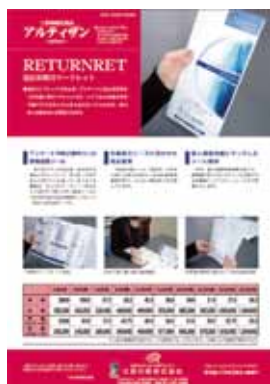
■創刊号 1月号 特集：リターンレット