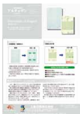
■第10号 10月号 特集：偽造防止加工