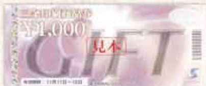
ホログラム加工されている物をコピー取るとこのようになります。