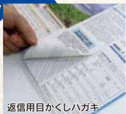
返信用目かくしハガキ