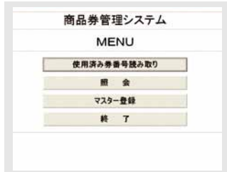
管理システムメニュー画面

発行した商品券がどのくらい利用され、どのくらい未使用があるのかや偽造券・重複券の使用履歴の判別をハンディーバーコードリーダーを用いて商品券No.で管理するシステムです。